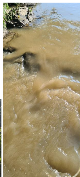
Eau teintée, difficile à pêcher, poissons peu visibles