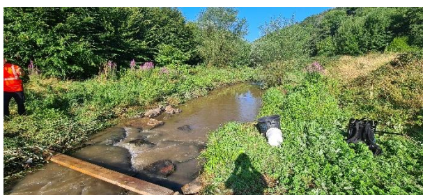
Vue du passage de la canalisation AEP