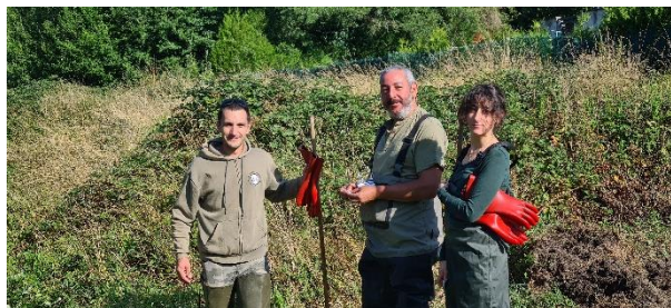
Bénévoles de l'AAPPMA