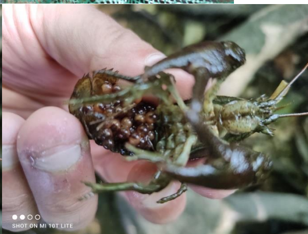
Captures du 17/07 : (V. Garnier directeur) dont femelle écrevisse grainée (œufs sous l'abdomen)