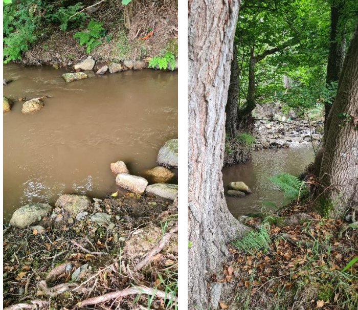
Eau trouble liée a des travaux situés en amont