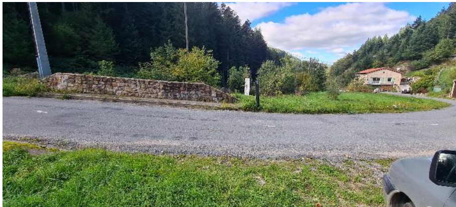
VUE DU SITE, et des captures le 06/10/25 sur le Dorlay Les Scies