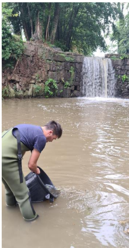
Déversement des captures en aval du seuil infranchissable aval travaux