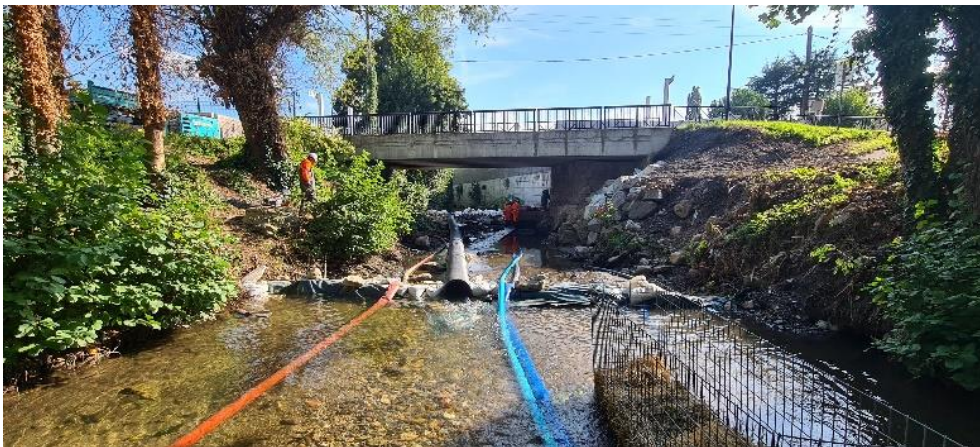
Vue du Chantier le 29-09-2025 lors d'une reprise de sauvetage post coup d'eau et batardage

Au total 20 truitelles de l'année (<110 mm), 1 chevaine de 200 mm, 10 loches, 400 à 500 vairons et une 50ne de chevaines < 50 mm