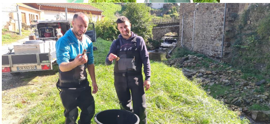
SITE DE PECHE ET CAPTURES DE CREVISSES AU NIVEAU DU CTM DE DOIZIEUX