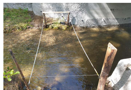
Dispositif de mesure sur la Durèze, à Chagnon.

Les stations de suivi ont été choisies avec les structures gestionnaires des rivières concernées. Ce sont les techniciens de ces structures qui réalisent les mesures nécessaires, en général une fois par semaine. La Fédération de pêche coordonne le réseau et centralise les données afin qu'elles puissent nourrir les réflexions du comité de gestion de la ressource du département, qui est notamment amené à prendre des restrictions d'usages de l'eau lorsque l'état des ressources le justifie.