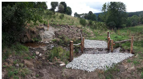
Réalisation d'un passage à gué

Ces travaux ont été réalisés durant le mois d'août par l'entreprise Société de Travaux d'Environnement et l'ensemble est financé par la Fédération de pêche Nationale, la Fédération de pêche de la Loire, l'AAPPMA La Truite du Haut Lignon Forézien, la Région Auvergne-Rhône-Alpes et le département de la Loire.