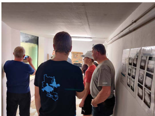
Visite de la station de comptage de la passe à poisson

Renseignements : sylver.biscarat@federationpeche42.fr