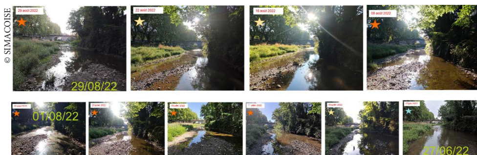
Evolution de la Coise à Saint-Galmier de fin juin à fin août 2022.

Au printemps 2021, la Fédération de pêche de la Loire a mis en place un réseau de suivi de certaines rivières du département pour la période estivale, en vue de mieux connaître l'évolution de leur état au cours de l'étiage. Ce réseau s'inspire du travail mené par l'Etablissement Public Dordogne, qui a mis en place un très vaste réseau de suivi sur tout son territoire.