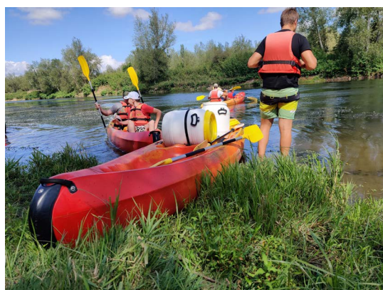
Découverte du fleuve Loire en canoë.