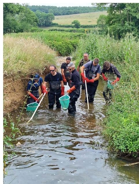
Pêche scientifique électrique

En plus des stations de suivis du RSPP, la FDAAPPMA réalise de nombreuses autres études et suivis des populations piscicoles pour des thématiques et problématiques très diverses qui vont du suivi des effets des travaux de renaturation écologique des milieux aquatiques (portés par les contrats territoriaux ou la FDPPMA42) , aux expérimentations et mesures halieutiques de protection des espèces piscicoles, en passant par les suivis long terme (débit réservé pour EDF, impact des barrages cas de celui des Plats sur la Semène), les impacts des pollutions ayant entraîné de fortes mortalités piscicoles avec l'évaluation de la reconquête ; les effets du changement climatique et des sécheresses à répétition... Selon les années cela peut porter sur les études bilans de bassin versant pour les contrats territoriaux ligériens.